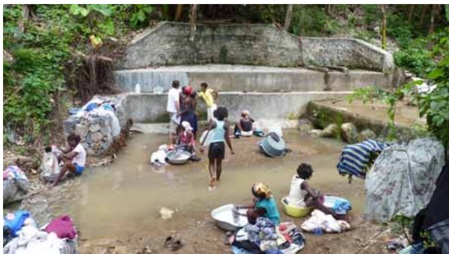
PROGRAMME EAU ET ASSAINISSEMENT DANS L'ARTIBONITE.

Ces actions se traduiront dans un premier temps par une identification précise des risques, puis par la formation de comités locaux chargés de sensibiliser les populations, de les assister en cas d'urgence et de les équiper en matériel d'alerte et de communication. Ce programme viendra compléter les activités menées par la Croix-Rouge américaine depuis plusieurs semaines dans les camps.