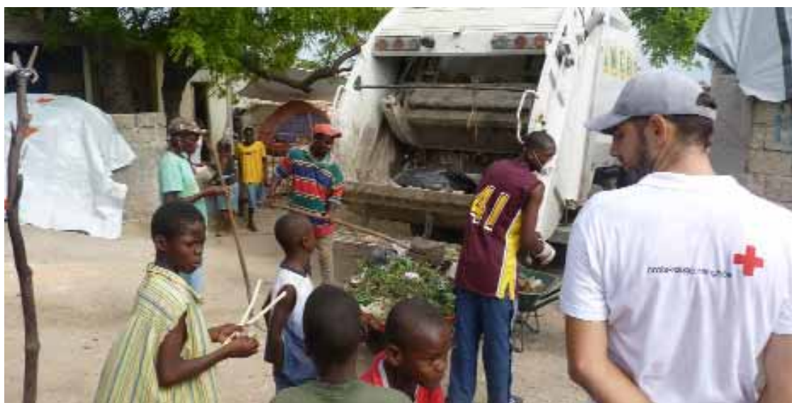
LA CROIX-ROUGE FRANÇAISE SENSIBILISE LA POPULATION DES CAMPS ET SITES DE RASSEMBLEMENT AUX QUESTIONS D'HYGIÈNE ET D'ASSAINISSEMENT.

Dans l'optique d'améliorer les conditions de vie de la population sur les sites de rassemblement et dans les camps, nos délégués et leurs équipes haïtiennes sensibilisent la population à toutes ces questions d'hygiène. Un comité de gestion local a été créé sur chaque site, composé de membres de la communauté, formés à l'utilisation et à la maintenance des ouvrages, ainsi qu'à la diffusion de messages d'hygiène de base. En outre, depuis le début avril, chaque samedi, des journées de l'assainissement sont organisées avec les équipes Croix-Rouge française et haïtienne sur un camp différent chaque semaine, afin d'initier les personnes au nettoyage des sites et d'impulser un effort communautaire régulier.