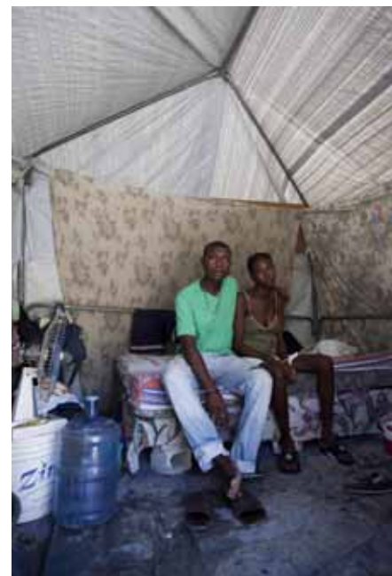
CAMP DE BONNEFIL, À PORT-AU-PRINCE, OÙ LA CROIX-ROUGE FRANÇAISE SOUTIEN 1 200 FAMILLES (JUN 2010).

Tous les chiffres figurant à l'intérieur de ce document ont été arrêtés à la date du 30 juin 2010.