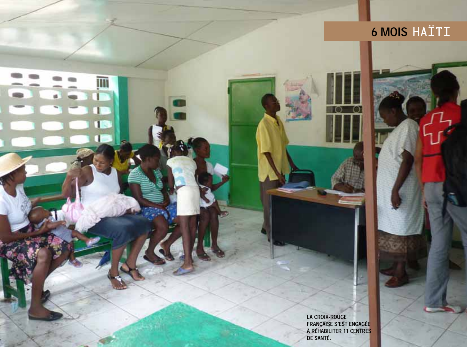
LA CROIX-ROUGE FRANÇAISE S'EST ENGAGÉE À RÉHABILITER 11 CENTRES DE SANTÉ.