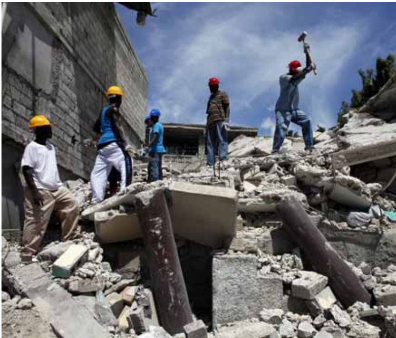
IMPASSE VOLCY, PORT-AU-PRINCE, DÉBUT DE LA RECONSTRUCTION AVEC LA PARTICIPATION DES HABITANTS.

Six mois après le séisme en Haïti, nous sommes dans une phase de transition : transition entre la phase d’assistance d’urgence, qui a duré près de quatre mois, et la phase de relèvement et de réhabilitation qui est amorcée. La première période a consisté à porter secours à la population et à répondre à ses besoins prioritaires en eau potable, en soins, en abris et en produits de première nécessité. Selon l’Office de coordination de l’aide humanitaire (Rapport de situation OCHA, 5 mai 2010), 100 % de la population affectée a reçu une aide de première urgence à Port-au-Prince. Il n’en demeure pas moins que la population continue de vivre dans des conditions très précaires et que la réponse humanitaire doit être renforcée. Aujourd’hui, notre priorité est d’adapter nos programmes