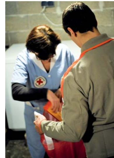
■ Donner du sens à la peine des jeunes mineurs : tel est l'enjeu des mesures de réparation pénale effectuées dans les délégations, comme ici à Saint-Omer (62)

Qu'il s'agisse des alternatives à l'incarcération (TIG ou mesure de réparation pénale) ou des aménagements de peine (libération conditionnelle, place-