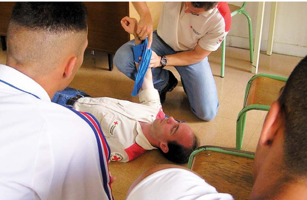
■ La Croix-Rouge française forme chaque année plus de 1 000 personnes détenues aux gestes qui sauvent, comme ici au centre pénitentiaire de Perpignan (66)

La Croix-Rouge française forme chaque année plus de 1 000 personnes détenues aux gestes qui sauvent. Savoir-faire reconnu de notre association, la formation aux premiers secours (IPS, PSC1, monitorat), validée par un diplôme européen , constitue une expérience stimulante et valorisante pour les personnes détenues mais aussi pour les personnels surveillants, pour qui elle peut représenter un plus dans l'exercice de leur métier. Durant la formation, les personnes se retrouvent en situation d'aide par rapport à autrui, et non plus dans un rapport de force. Cette sensibilisation au respect de l'autre constitue une approche éducative enrichissante en détention.