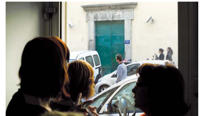
■ 85 000 personnes sortent chaque année de prison

La sortie est un moment crucial qui doit se préparer largement en amont, dès l'entrée en détention, mais qui doit également être accompagné et encadré au moment de la libération effective. Dans cette perspective, notre association souhaite multiplier la création de lieux d'accueil et d'orientation qui permettront aux personnes ayant accompli leur peine d'être accompagnées dans leurs démarches. Elle encourage également les initiatives visant à préparer la sortie dès l'entrée en détention, comme le service d'un écrivain public ou encore la mise en place d' ateliers de réinsertion professionnelle .