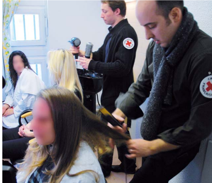
■ Après l'ouverture d'un salon de coiffure, la Croix-Rouge française a inauguré un salon d'esthétique à la maison d'arrêt de Strasbourg (novembre 2010)