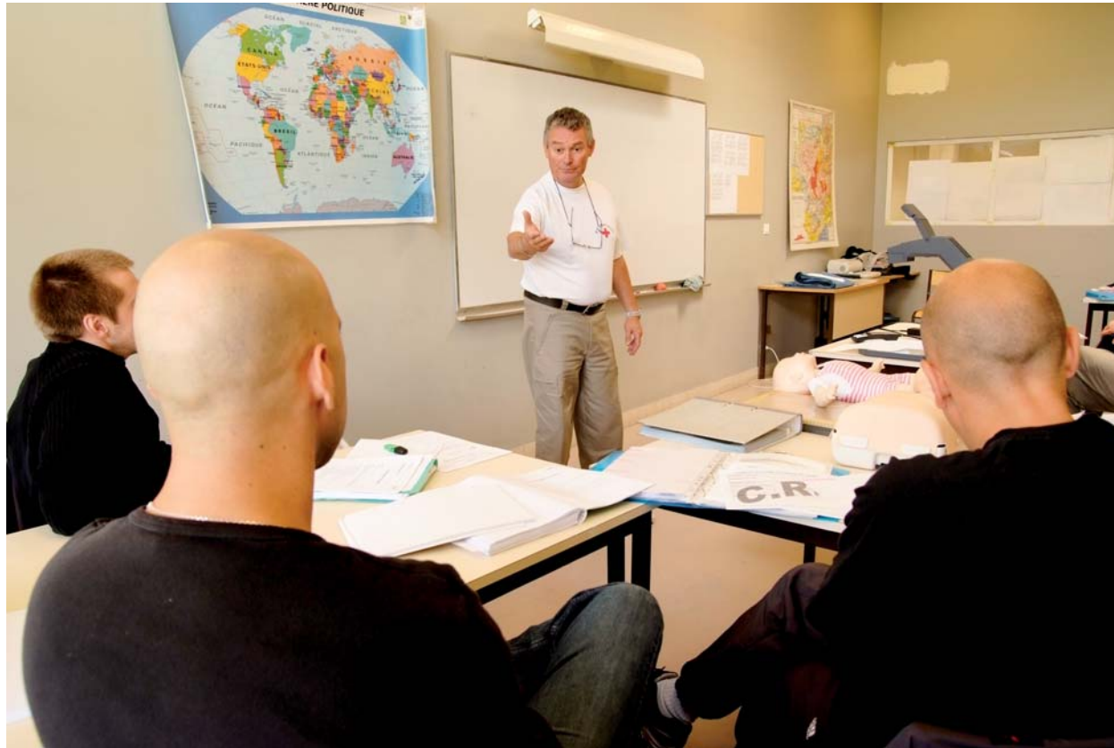
■ A la maison centrale de Saint-Maur (36), nos bénévoles forment les personnes condamnées à de longues peines au monitorat de secourisme

Dans la droite ligne de son projet associatif « Humaniser la vie », la Croix-Rouge française intervient au-delà de tout jugement, pour soulager la souffrance des personnes incarcérées et leur offrir des conditions de détention qui respectent la dignité humaine.