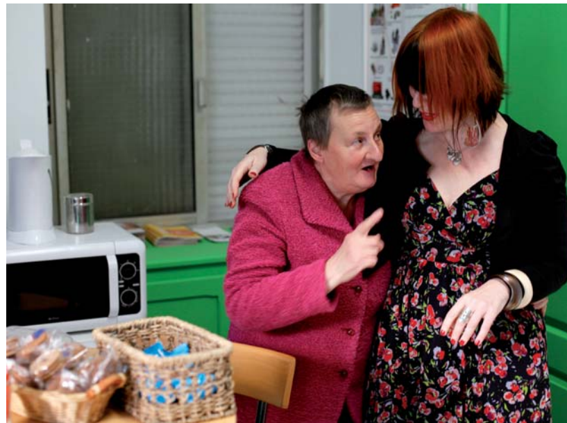
■ Chaque année, près de 55 000 personnes sont accueillies par des bénévoles de l'association dans des lieux d'accueil pour familles en attente de parler, comme ici à Ajaccio

En prison, le maintien des liens familiaux peut prendre plusieurs visages : permettre à un parent détenu en situation précaire d'offrir à son enfant un jouet à Noël, organiser un goûter festif et familial en détention, participer à l'accueil des familles en attente de parler, ou encore proposer un service de navette entre la gare et l'établissement pénitentiaire lorsque ce dernier est mal desservi.