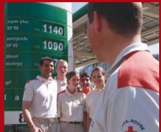
Formation aux gestes qui sauvent dans les stations BP

Cette action s'est prolongée par des actions de formation proposées aux vacanciers, lors des départs d'été.