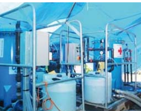
Assainissement de l'eau par Veolia Water Force

La contribution des entreprises à l'effort global de lutte contre le sida doit être amplifiée.