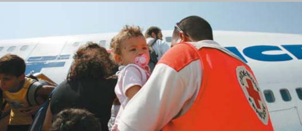
Rapatriement des français du Liban