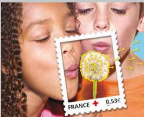
Concours « Dessine ton timbre pour les enfants du monde »

Ce partenariat se décline année après année, avec une extension aux Chèques Cadeaux d'Accentiv', et bientôt aux Ticket CESU (Chèque Emploi Service Universel).