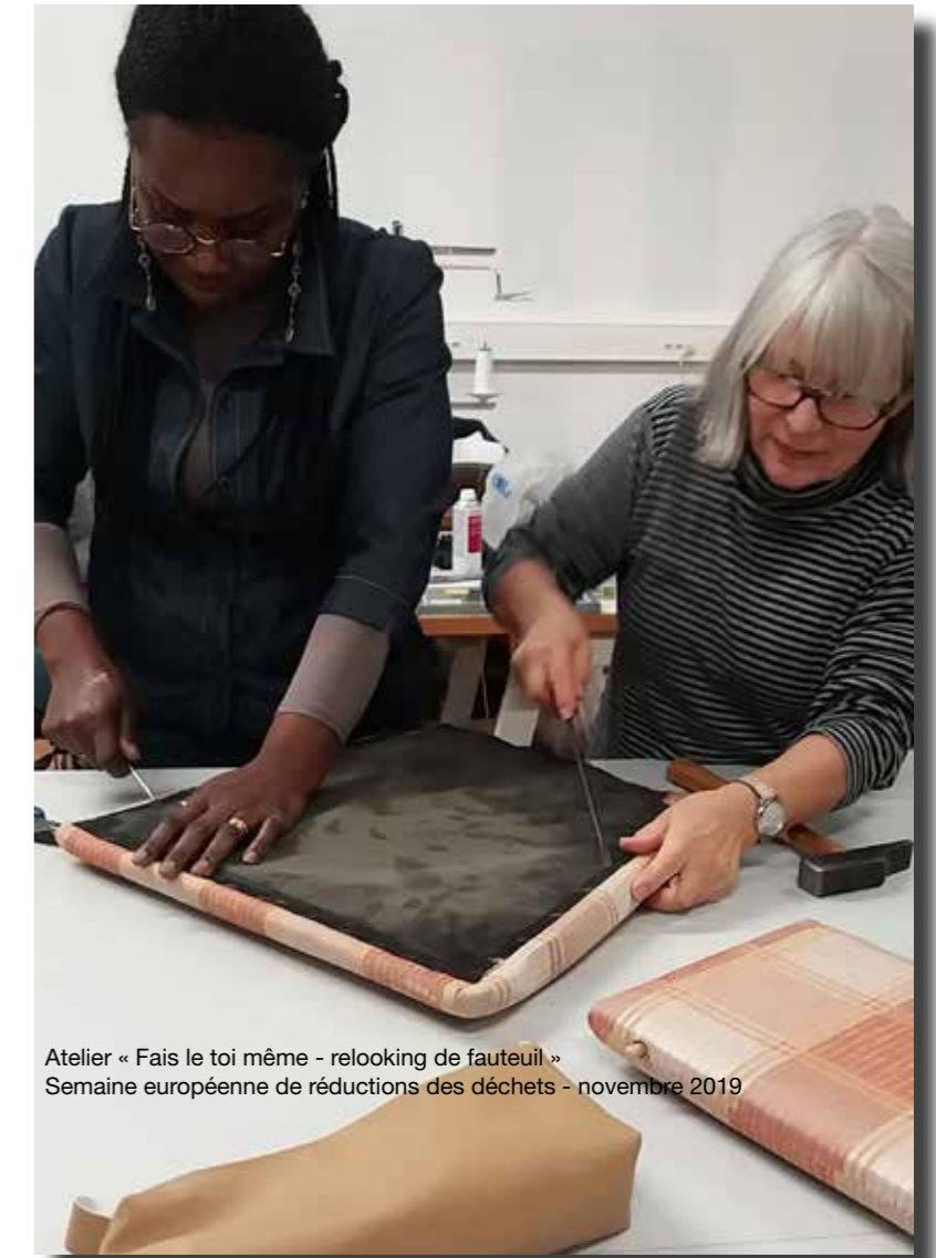
Atelier « Fais le toi même - relooking de fauteuil » Semaine européenne de réductions des déchets - novembre 2019