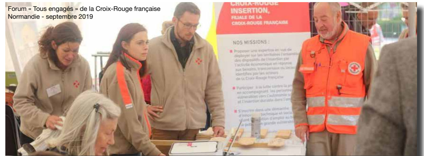
Forum « Tous engagés » de la Croix-Rouge française Normandie - septembre 2019