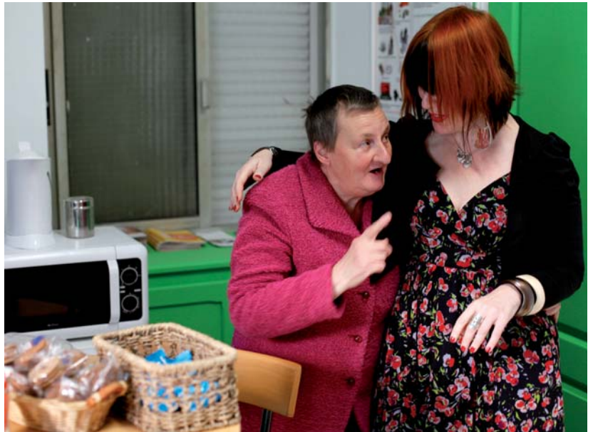
■ Chaque année, près de 55 000 personnes sont accueillies par des bénévoles de l'association dans des lieux d'accueil pour familles en attente de parler, comme ici à Ajaccio

En prison, le maintien des liens familiaux peut prendre plusieurs visages : permettre à un parent détenu en situation précaire d'offrir à son enfant un jouet à Noël, organiser un goûter festif et familial en détention, participer à l'accueil des familles en attente de parler, ou encore proposer un service de navette entre la gare et l'établissement pénitentiaire lorsque ce dernier est mal desservi.