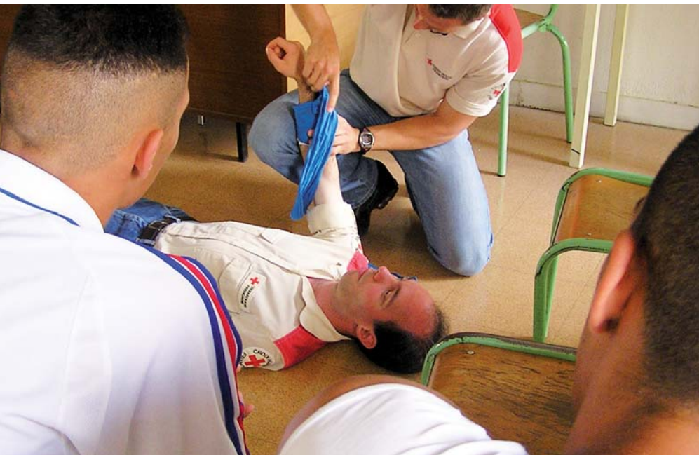
■ La Croix-Rouge française forme chaque année environ 1 000 personnes détenues aux gestes qui sauvent, comme ici au centre pénitentiaire de Perpignan (66)

La Croix-Rouge française forme chaque année environ 1 000 personnes détenues aux gestes qui sauvent. Savoir-faire reconnu de notre association, la formation aux premiers secours (IPS, PSC1, monitorat), validée par un diplôme européen , constitue une expérience stimulante et valorisante pour les personnes détenues mais aussi pour les personnels surveillants, pour qui elle peut représenter un plus dans l'exercice de leur métier. Durant la formation, les personnes se retrouvent en situation d'aide par rapport à autrui, et non plus dans un rapport de force. Cette sensibilisation au respect de l'autre constitue une approche éducative enrichissante en détention.