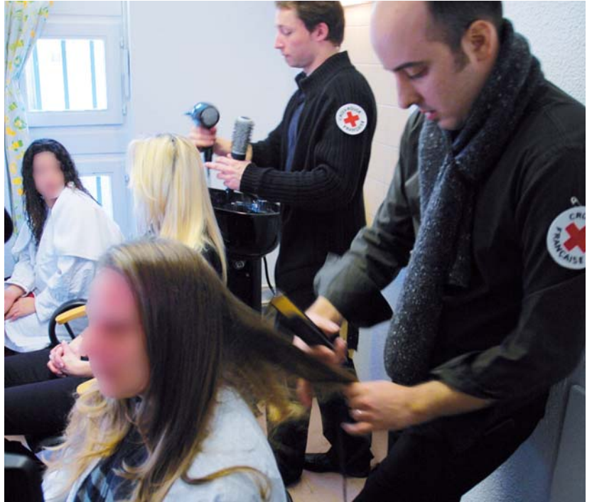
■ Après l'ouverture d'un salon de coiffure, la Croix-Rouge française a inauguré un salon d'esthétique à la maison d'arrêt de Strasbourg (novembre 2010)